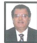
Senador Gilberto Herrera Ruíz INTEGRANTE