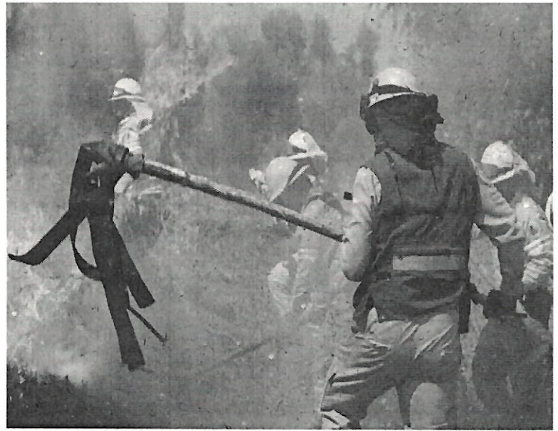
Brigadistas de CORENADR y DGSANPAVA.