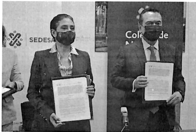
Firma del Convenio de Colaboración en el 2022

En beneficio de los residentes de la Ciudad de México y la buena relación con el Colegio de Notarios, año con año, se ha firmado el Convenio de Colaboración con el objetivo de reducir los honorarios notariales con relación a la suscripción del documento de Voluntad Anticipada e incluso se ha extendido la vigencia para que abarque prácticamente todo el año. Es importante mencionar que la Voluntad Anticipada es un indicador de calidad en la atención al paciente y su familia, referido en el apartado de los derechos del paciente de la Guía del Manejo Integral de Cuidados Paliativos, ya que, promueve la buena práctica, la cultura de la evaluación, la mejora continua, además son una guía para el personal de salud en su labor asistencial y humana.