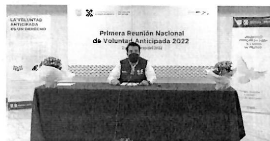
1º Reunión Nacional de Voluntad Anticipada 2022