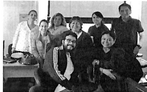
Diplomado Formación Intermedia en Cuidados Paliativos 2019