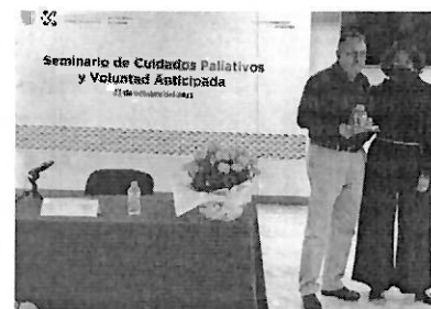
2 Seminario de Cuidados Paliativos 2021