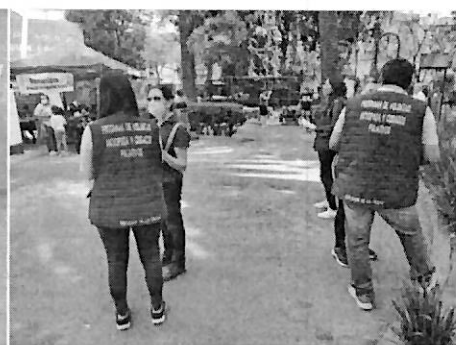
Promoción de Voluntad Anticipada y Cuidados Paliativos en las Ferias del Bienestar