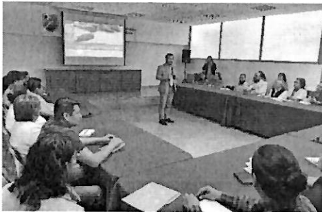
Sesión Académica Cuidados Paliativos 2019

Servicios Legales de la Ciudad de México ( CEJUR ), lo anterior, derivado de las necesidades detectadas en su personal y a fin de favorecer la atención de los usuarios.