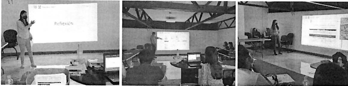
Taller sobre el llenado del Formato de Voluntad Anticipada 2022

En representación de la SEDESA, el Programa presento tres carteles sobre: el Modelo de atención psicoemocional para el personal de salud que atendió pacientes con COVID-19, la Capacitación a distancia sobre cuidados paliativos y Recomendaciones para la suscripción de Voluntad Anticipada en pacientes con COVID-19 las cuales fueron aprobadas y se compartieron durante la Jornada Virtual Latinoamericana de Cuidados Paliativos 2021 de la Asociación Latinoamericana de Cuidados Paliativos.