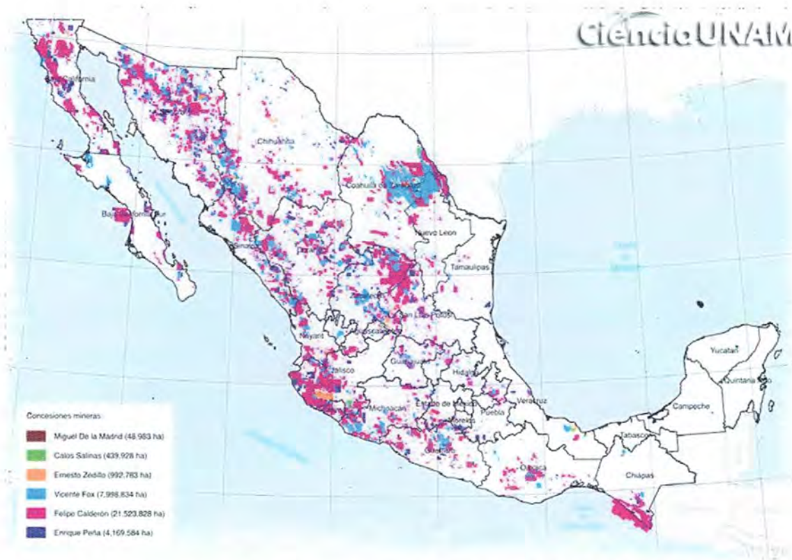
Evolución de la distribución geográfica de las concesiones mineras en México, 1982-2015. Fuente: Secretaría de Economía (2015). Canadá y Estados Unidos controlan más del 80% de la minería mexicana. Proyectos mineros en México, CIGA-UNAM

El siguiente mapa, elaborado por la UNAM, muestra de manera clara cómo se expandió la superficie de las concesiones mineras en México durante el periodo neoliberal, pero sobre todo en los sexenios de Vicente Fox Quesada y Felipe Calderón Hinojosa.