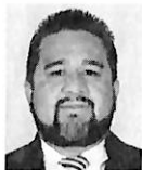
Dip. Gustavo Contreras Montes (MORENA)