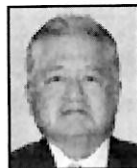
Dip. Valentín Reyes López MORENA-Veracruz