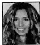
Dip. Araceli Ocampo Manzanares Morena - Guerrero