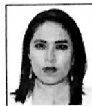
Dip. Simey Olvera Bautista MORENA - Hidalgo