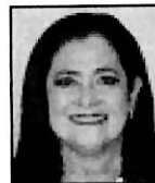
Dip. Blanca Araceli Narro Panameño MORENA-Tamaulipas