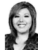
Dip. Genoveva Huerta Villegas PAN-Puebla