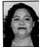
Dip. Verónica Collado Crisola MORENA-México