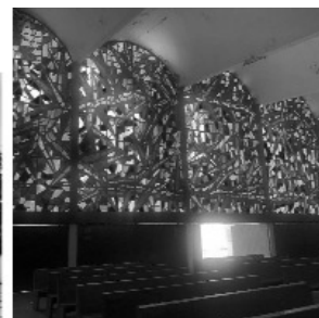
Iglesia (exterior), y vitral (interior) diseñados por Israel Katzman