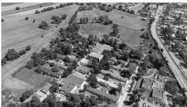
Vista aérea de parte del complejo, fotografía de Elianne Islas

En 1936, año en que se mandata a construir el área de los pabellones y demás instalaciones en las que vivirían los enfermos, la lepra era un problema nacional de gran relevancia, el asilo de Zoquiapan significó, de primer momento, un avance en las políticas de salud que permitió atender a muchos pacientes de todo el país. Su relevancia es tal, que fue la última leprosería con ese carácter a nivel nacional, como ya se ha dicho en los antecedentes. Por lo que su cuidado y conservación histórica es necesaria. Además, hoy en día el hospital cuenta con un museo que debe ser reconocido, documentado y catalogado por las autoridades correspondientes, se trata del Museo Dr. Santamaría . Como también se advirtió en los antecedentes, el asilo contaba con una iglesia construida por el reconocido arquitecto Israel Katzman, misma que se encuentra adornada por un vitral de gran valor artístico.