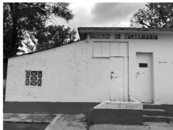
Fachada del museo Dr. Santamaría