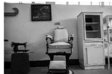
Diario Oficial de la federación y diversos instrumentos dentro del museo, fotografías de

Por otro lado, un aspecto digno de protección y estudio es el mural que se encuentra pintado en las cuatro paredes del edificio que otrora funcionara como biblioteca (hoy área de enseñanza). Por lo que puede leerse fue pintado en 1946, y que en la actualidad ha sido afectado severamente por la humedad, adjunto a esta proposición el material fotográfico probatorio. En este sentido, la misma ley, pero a través del Inbal y no del INAH, como en el caso de la hacienda y el museo, también puede certificarlo como una obra artística con carácter de monumento: