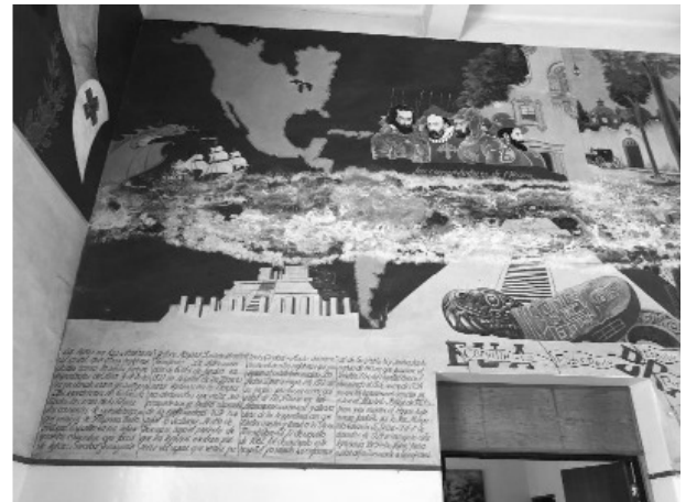
Fotografía panorámica de tres de las cuatro paredes del mural, y ampliación de una de las zonas que requiere más atención.

Estos puntos, denotan la pertinencia de esta proposición, no se debe olvidar que fueron muchas las personas a quienes se les violentaron sus derechos humanos, y que, por ignorancia y un trato incapaz, se les mancillo por completo la vida. La historia debe preservarse, porque el que no conoce su historia lleva en sí la condena de volver a repetir los errores del pasado.