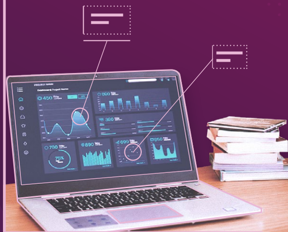
Cuarto Informe Trimestral de Actividades 2020

El Instituto Federal de Telecomunicaciones (Instituto o IFT) presenta los resultados de su actuar durante octubre-diciembre de 2020, en donde se muestran los asuntos que resolvió el Pleno, la captación que se ingresó a la Tesorería de la Federación (TESOFE) por 71.76 Millones de pesos (Mdp); la atención a las inconformidades de los usuarios de servicios de telecomunicaciones, las acciones para la promoción de la igualdad de género, diversidad e inclusión, entre otras actividades.