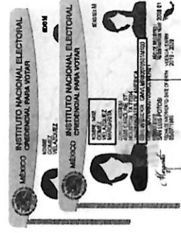
Tipo G y H