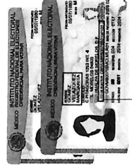
Tipo D y F

OCR 12 ó 13 Dígitos Reverso de la credencial