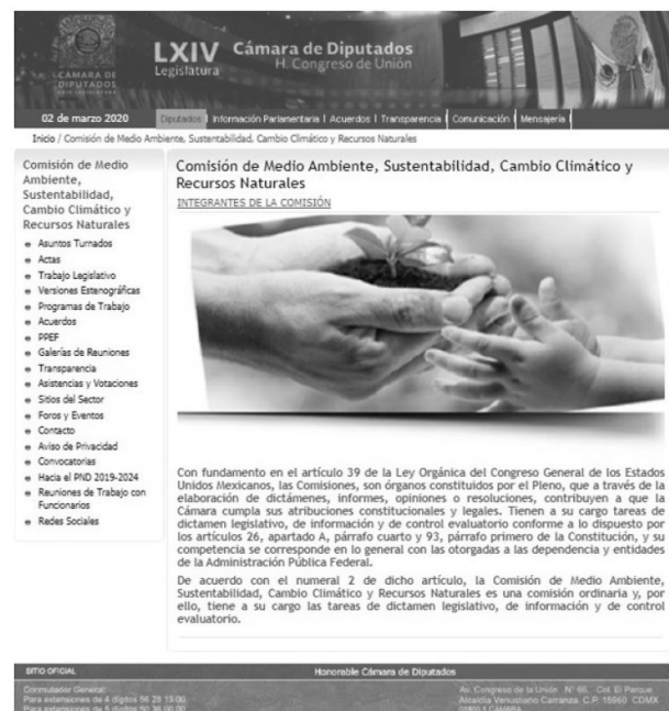
Figura 1. Aspecto de la página de inicio del micrositio de la Comisión

para mantener comunicación con todo público interesado en la materia.