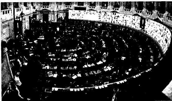
Cámara de diputados Argentina

En países como Colombia, Ecuador, Chile, Brasil, Reino unido, Canadá, Estados Unidos, Paraguay y Argentina coincidieron en sesionar de manera virtual, En Argentina optaron por una pantalla gigante montada dentro del recinto que permitió la conexión de todos los miembros, que realizaron la votación en forma electrónica previa validación de sus identidades y de viva voz, los congresistas destacaron el buen funcionamiento del sistema de sesiones remotas y trabajaban en la formulación de la agenda legislativa. 9