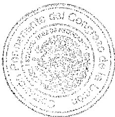
DIP. SERGIO CARLOS GUTIÉRREZ LUNA Secretario