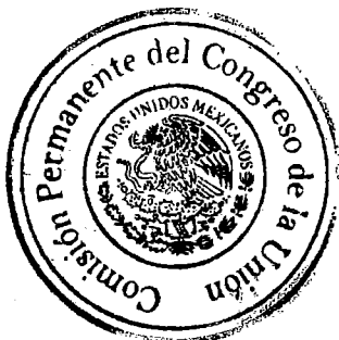
DIP. SERGIO CARLOS GUTIÉRREZ LUNA Secretario