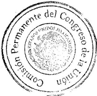
DIP. SERGIO CARLOS GUTIÉRREZ LUNA Secretario