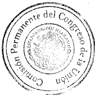
DIP. SERGIO CARLOS GUTIÉRREZ LUNA Secretario