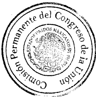
DIP. SERGIO CARLOS GUTIÉRREZ LUNA Secretario