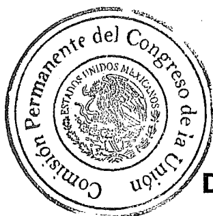
DIP. SERGIO CARLOS GUTIÉRREZ LUNA Secretario