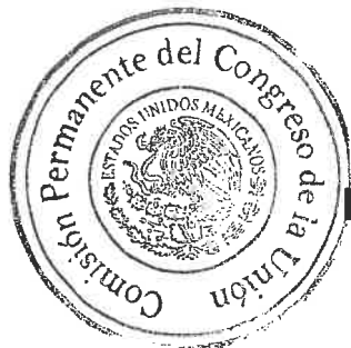
DIP. SERGIO CARLOS GUTIÉRREZ LUNA Secretario