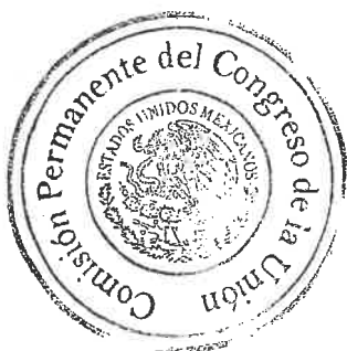
DIP. SERGIO CARLOS GUTIÉRREZ LUNA Secretario