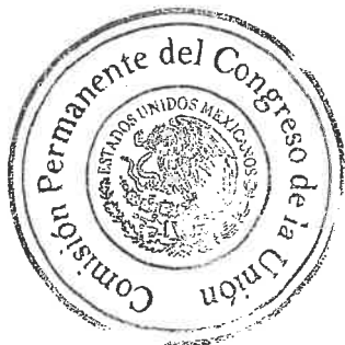
DIP. SERGIO CARLOS GUTIÉRREZ LUNA Secretario