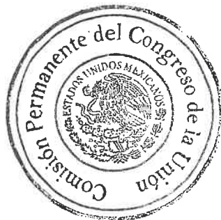
DIP. SERGIO CARLOS GUTIÉRREZ LUNA Secretario