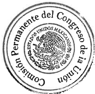
DIP. SERGIO CARLOS GUTIÉRREZ LUNA Secretario