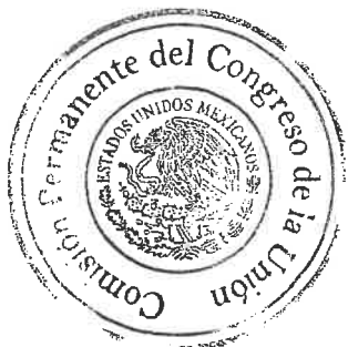
DIP. SERGIO CARLOS GUTIÉRREZ LUNA Secretario