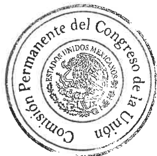
DIP. SERGIO CARLOS GUTIÉRREZ LUNA Secretario