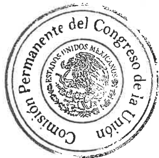
DIP. SERGIO CARLOS GUTIÉRREZ LUNA Secretario