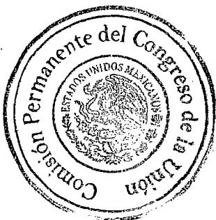
DIP. SERGIO CARLOS GUTIÉRREZ LUNA Secretario