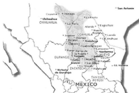
*Mapa de los estados en donde se ubica la planta candelilla. 2

Las flores aparecen de febrero a agosto, siendo más común entre marzo y abril en el centro y sur del estado de Coahuila. Durante época de lluvias, los tallos de la candelilla se llenan de una savia espesa, la cual en épocas secas recubre el tallo con cera para evitar su desecación. 1 En este sentido, la mejor época para su aprovechamiento se realiza principalmente entre los meses de octubre a junio, y la producción natural es de 189.3 kilogramos por hectárea.