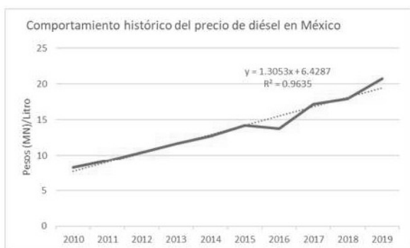
Figura 2. Ilustración que ejemplifica el aumento anual del combustible en México.

Lo costos antes descritos, están directamente relacionado con el costo del combustible en México, el cual continúa presentando aumentos anuales con comportamiento lineal ascendente (figura 2), que además de repercutir en forma directa en el costo de producción, indirectamente confiere aumento en los costos de todos los insumos empleados por dichas actividades.