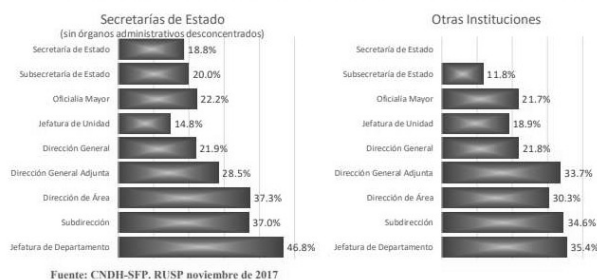
Gráfica 4. Porcentaje de mujeres, en mandos medios y superiores, por puesto en la APF

7. La brecha de género se manifiesta también en los sueldos dentro de la administración pública, los cuales, pueden ser asignados a partir del tabulador de nómina que cada institución y/o Secretaría determine. En ese sentido, las y los diputados proponentes de este punto de acuerdo urgen al Gobierno de Baja California no sólo mediante el cumplimiento del principio de paridad de género en todos los niveles, sino también, mediante la implementación de paridad salarial bajo el principio de “mismo pago ante misma actividad laboral”. Se ha demostrado que esta brecha está documentada en diversos estudios, citándose el más reciente de la Comisión Nacional de Derechos Humanos de donde se desprende que las mujeres obtienen menores salarios que los hombres, señalando tales diferencias “dentro del rango de -2.5% (menos salario para las mujeres) a 1.9% (más salario para las mujeres) en el conjunto de las Secretarías” 3