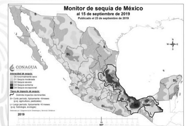
Monitor de Sequía de México

Aunado a esta problemática de sequías, se suman los incendios que se presentaron en el país en los diferentes estados en lo que va del año, que en total sumaron 7 mil 293 con una superficie afectada de 599 mil 13. Los estados con mayor superficie afectada fueron Jalisco, Durango, Oaxaca, Nayarit, Guerrero, Chihuahua, Chiapas, San Luis Potosí, Sonora y Guanajuato, en los cuales parte del suelo afectado es dedicado a la siembra, como observamos en la siguiente gráfica: