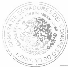
SEN. MARTÍ BATRES GUADARRAMA Presidente

SALÓN DE SESIONES DE LA HONORABLE CÁMARA DE SENADORES. - Ciudad de México, 15 de noviembre de 2018