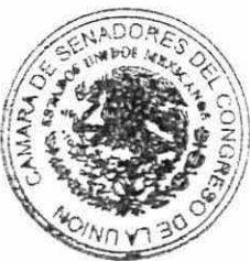
SEN. CÉSAR OCTAVIO PEDROZA GAITÁN Vicepresidente