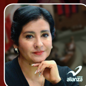
Dip. Angélica Reyes Ávila