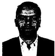
Dip. Jorge Álvarez Maynez Secretario