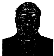
Dip. Manuel Jesús Clouthier Carrillo Integrante