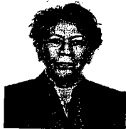
Dip. Delfina Gómez Álvarez Integrante