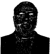
Dip. Manuel Jesús Clouthier Carrillo