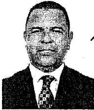
DIPUTADO CARLOS SARABIA CAMACHO