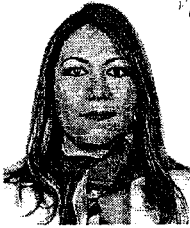
DIPUTADA CRISTINA SÁNCHEZ CORONEL

DICTAMEN A LA PROPOSICIÓN CON PUNTO DE ACUERDO, POR EL QUE LA CAMARA DE DIPUTADOS EXHORTA A DIVERSAS INSTITUCIONES PARA ATENDER Y APOYAR LOS MUNICIPIOS DE LA SIERRA NORTE DE PUEBLA AFECTADOS POR LOS HECHOS OCURRIDOS EL 5 Y 6 DE AGOSTO DE 2016 CON MOTIVO DE LAS TORMENTA TROPICAL "EARL".