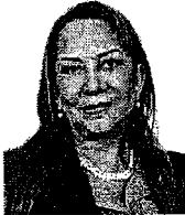
DIPUTADA ARACELI MADRIGAL SÁNCHEZ Secretaria

DICTAMEN A LA PROPOSICIÓN CON PUNTO DE ACUERDO, POR EL QUE LA CAMARA DE DIPUTADOS EXHORTA A DIVERSAS INSTITUCIONES PARA ATENDER Y APOYAR LOS MUNICIPIOS DE LA SIERRA NORTE DE PUEBLA AFECTADOS POR LOS HECHOS OCURRIDOS EL 5 Y 6 DE AGOSTO DE 2016 CON MOTIVO DE LAS TORMENTA TROPICAL "EARL".