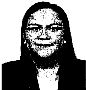
Dip. Ariadna Montiel Reyes Integrante