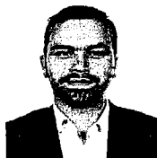
Dip. Jorge Álvarez Maynez Secretario