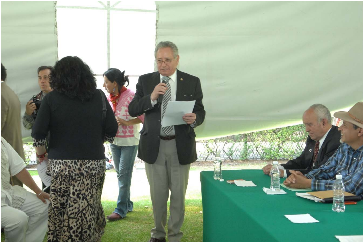
En el DÍA MUNDIAL DE LA MADRE TIERRA, el 22 de abril DE 2015