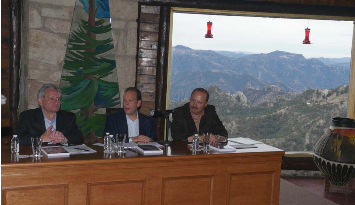
Barrancas del Cobre, Chih., 28 de enero de 2015