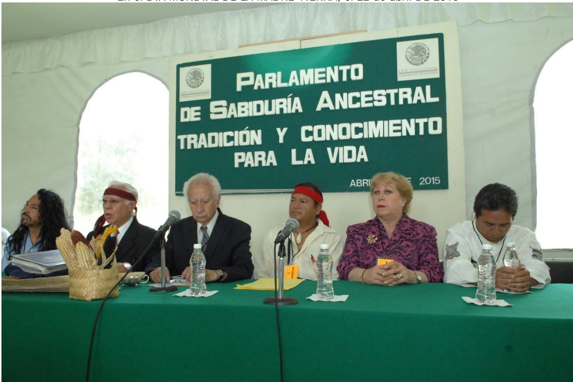
Jardín del Edificio B, del Palacio Legislativo de San Lázaro