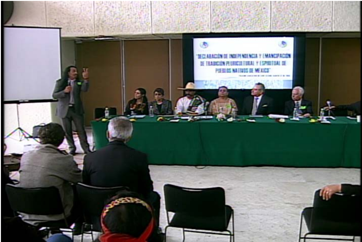
Salón C de Cristales, Edificio G, del Palacio Legislativo de San Lázaro. 2013