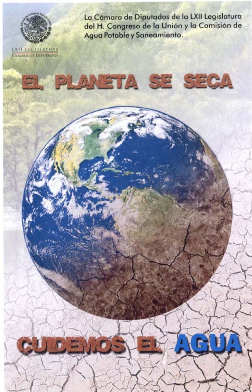
IX.2.- Campaña 2014.- Programa Cultura del Agua CUIDEMOS EL AGUA