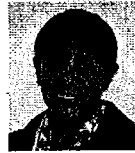
Sen. Luisa María Calderón Hinojosa PAN Lista Nacional