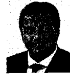
Sen. Raúl Aarón Pozos Lanz PRI Campeche