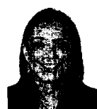
Dip. Mónica García de la Fuente PVEM Aguascalientes