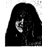
Sen. Iris Vianey Mendoza Mendoza PRD Lista Nacional