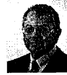
Sen. Manuel Camacho Solís PRD Lista Nacional