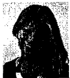
Sen. María Marcela Torres Peimbert PAN Querétaro