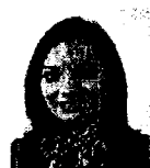
Sen. Mely Romero Celis PRI Colima