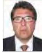
Dip. Ricardo Monreal Ávila MC Distrito Federal

Asimismo, participaron en forma activa como integrantes con carácter sustituto, en función del Acuerdo relativo a las Sesiones y al Orden del Día, aprobado por la Comisión Permanente el 27 de diciembre de 2012, los siguientes legisladores: