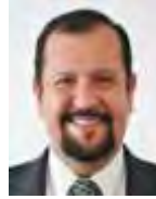
Sen. Manuel Humberto Cota Jiménez PRI Nayarit