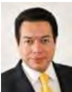
Sen. Mario Martín Delgado Carrillo PRD Distrito Federal