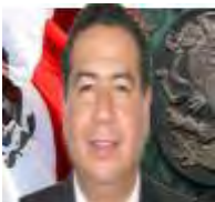
Dip. Ricardo Mejía Berdeja

Asimismo, participaron en forma activa como integrantes con carácter sustituto, en función del Acuerdo relativo a las Sesiones y al Orden del Día, aprobado por la Comisión Permanente el 27 de diciembre de 2012, los siguientes legisladores: