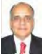
Dip. Manuel Añorve Baños PRI Guerrero