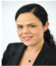
Sen. Mariana Gómez Del Campo Gurza PAN Distrito Federal