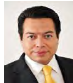
Sen. Mario Martín Delgado Carrillo PRD Distrito Federal