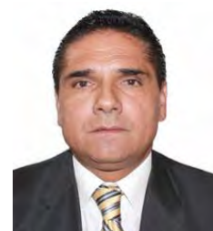
Dip. Silvano Aureoles Conejo PRD Michoacán