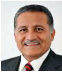
Sen. Arturo Zamora Jiménez PRI Jalisco