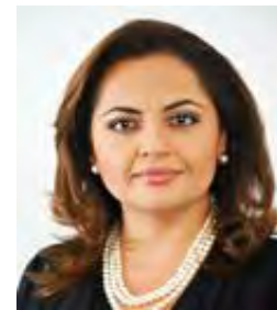
Sen. Ana Lilia Herrera Anzaldo PRI México