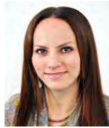
Sen. Gabriela Cuevas Barron PAN Distrito Federal