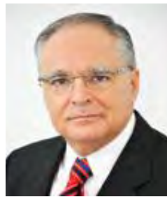
Sen. Miguel Romo Medina PRI Aguascalientes