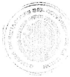
SEN. JOSÉ ROSAS AISPURO TORRES Vicepresidente

SALÓN DE SESIONES DE LA HONORABLE CÁMARA DE SENADORES.- México, D.F., a 19 de diciembre de 2012.