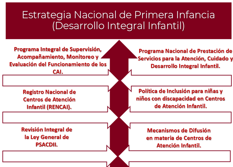
Esquema de trabajo de los 6 grupos, para fortalecer la Estrategia Nacional

Finalmente, es importante mencionar que con las aportaciones de todas y cada una de las instituciones que forman parte del Consejo Nacional, se trabajará en la construcción de la Estrategia Nacional de Primera Infancia a que alude la reciente reforma al artículo tercero constitucional, así como continuar dando un debido cumplimiento a lo dispuesto en la Ley General de Prestación de Servicios para la Atención, Cuidado y Desarrollo Integral Infantil.