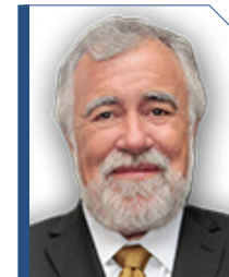
Sen. Alejandro Encinas Rodríguez PRD