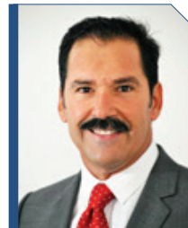
Sen. Jesús Casillas Romero PRI