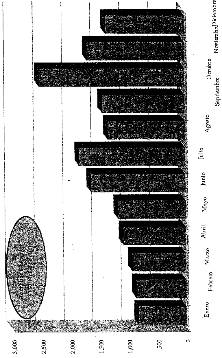
Integración Mensual de Intereses, Ejercicio 2013 (Miles de pesos)