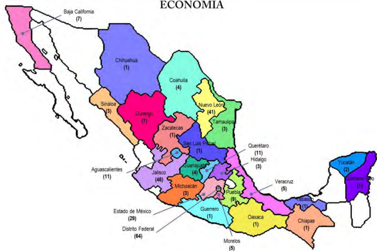
ESTADOS DE LA REPUBLICA DONDE EXISTEN OEC ACREDITADOS PARA EVALUAR LA CONFORMIDAD CON NOM DE LA SECRETARÍA DE ECONOMÍA