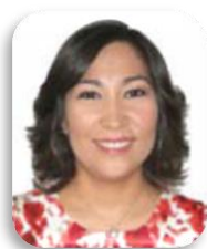
Dip. Lizbeth Loy Gamboa Song PRI