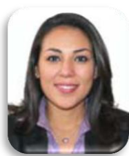
Dip. Aurora Denisse Ugalde Alegría PRI