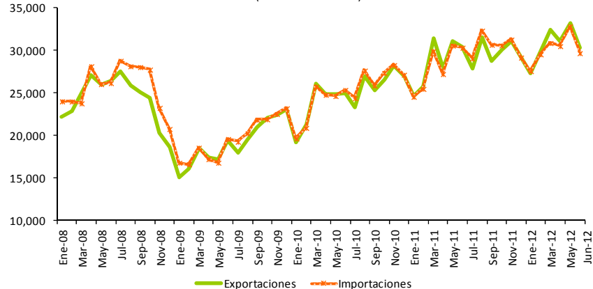
Evolución de las Exportaciones e Importaciones, 2008 - 2012/junio 1 (millones de dólares)

El nivel mensual de los precios se explicó, principalmente, por el aumento en la cotización de los productos agropecuarios (primordialmente el pollo, huevo, jitomate) y el de las mercancías (esencialmente alimentos procesados). Por su parte, la inflación general anual continúa repuntando; en julio de 2012 fue de 4.42 por ciento, mayor a la del mismo mes del año pasado (3.55%).